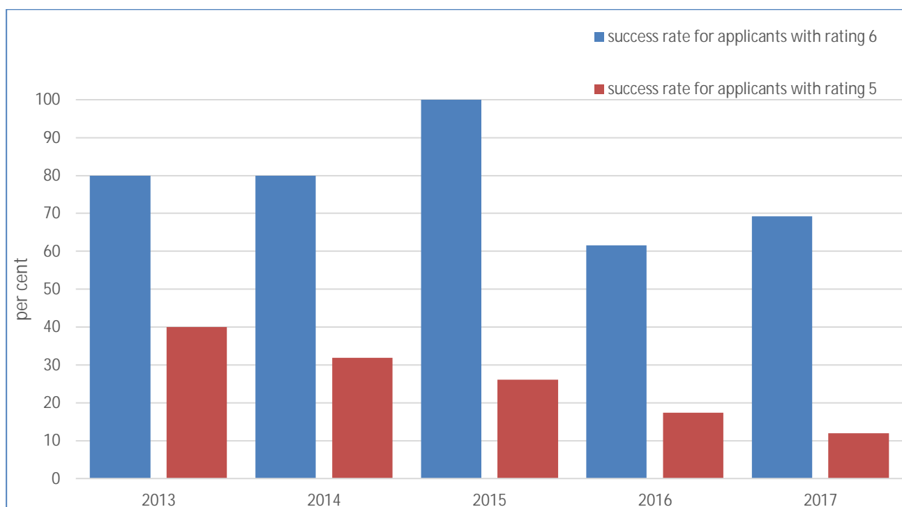
Figure 1. Proportion of funded Academy Research Fellows of all applicants with rating 5 and 6 in 2013-2017.

The Research Council’s total funding for Academy Research Fellow posts amounted to some 5.2 million euros, granted to cover the researchers’ salaries. The Academy Research Fellows can also apply for funding for their research costs. The decisions on research cost funding will be made on 16 May. We will contact the new Academy Research Fellows and open a dedicated call for applications for research cost funding. At the first stage, the research cost funding covers three years and amounts to a maximum of 275,000 euros.